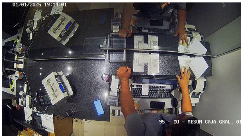
Jornada 15/01/2025 – Carpeta 373875 PR