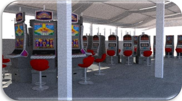
Vista interior de ampliación de terrazza para máquinas de azar