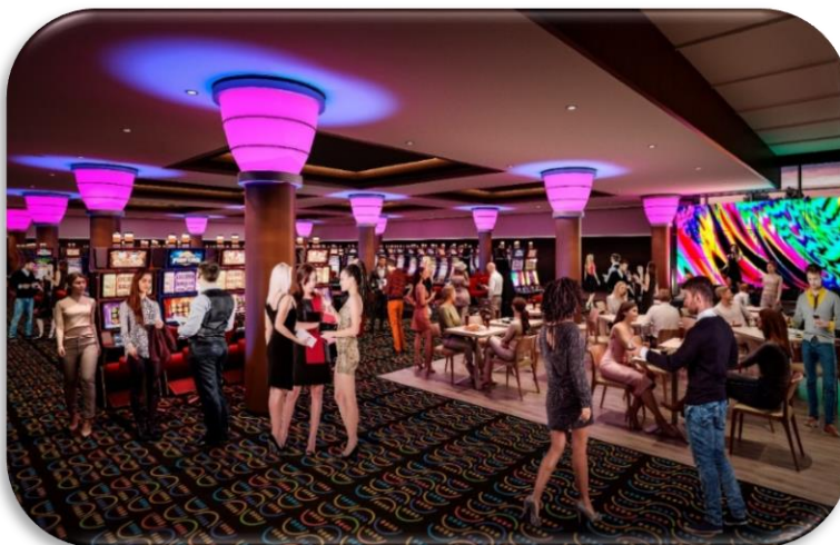
Remodelación del proyecto integral